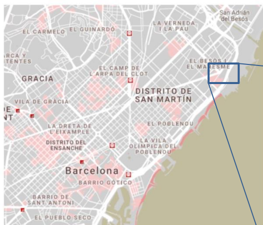
Situación de la sede central del Museu de Ciències Naturals de Barcelona.

Las sesiones científicas se celebrarán el jueves 5 y el viernes 6, en horario de mañana y tarde. El miércoles 4 y el sábado 7 de septiembre se destinarán a la realización de las excursiones científicas.