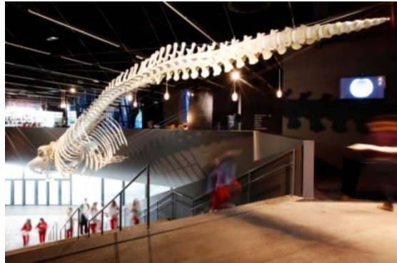
Museu de Ciències Naturals de Barcelona